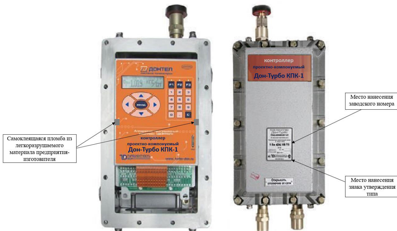
Рисунок 2 – Общий вид контроллеров в исполнении корпуса КПК-1 с указанием места нанесения заводского номера, места нанесения знака утверждения типа и мест пломбировки

Общий вид контроллеров с указанием места нанесения заводского номера, места нанесения знака утверждения типа и мест пломбировки представлен на рисунках 2-5. Нанесение знака поверки на контроллеры не предусмотрено.