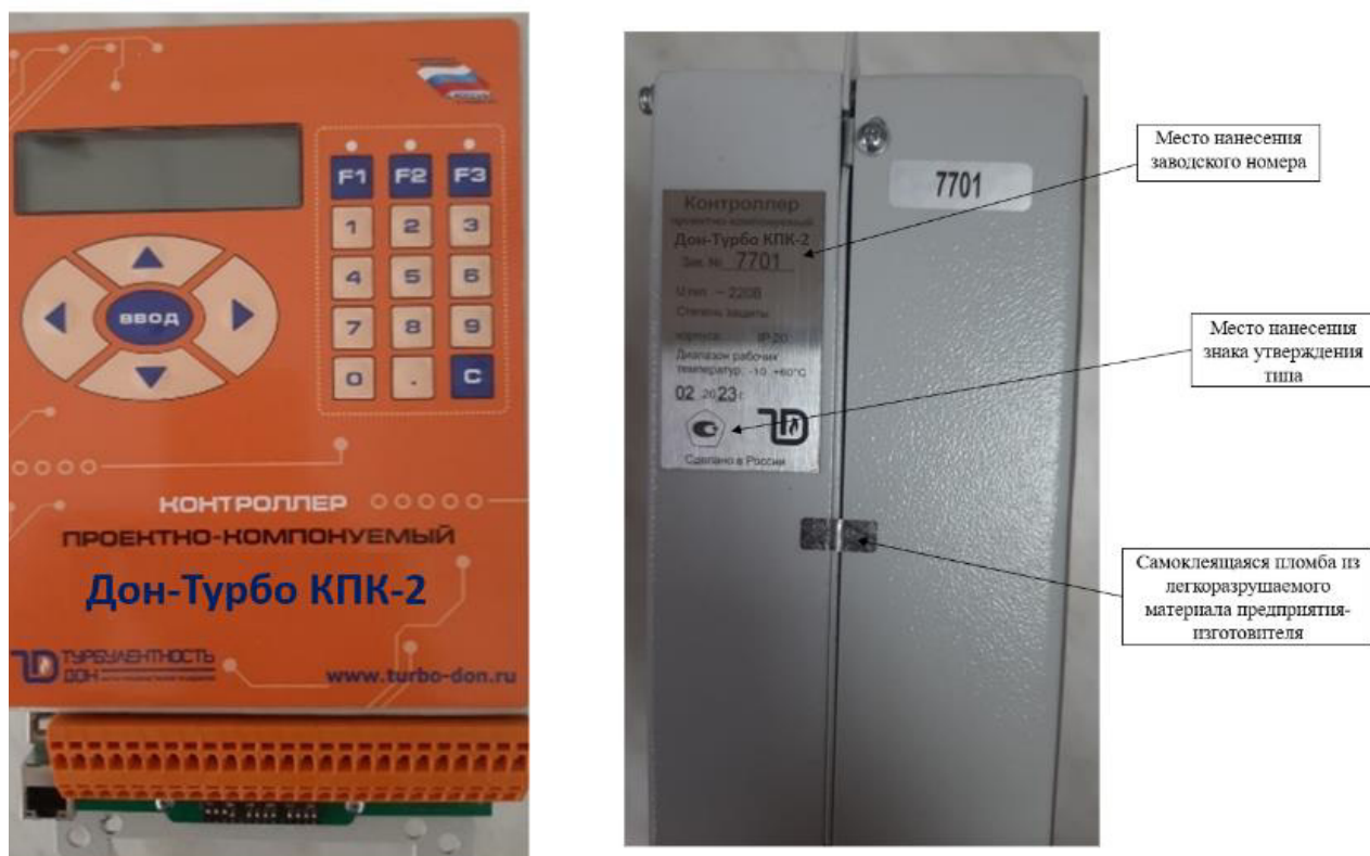
Рисунок 3 – Общий вид контроллеров в исполнении корпуса КПК-2 с указанием места нанесения заводского номера, места нанесения знака утверждения типа и мест пломбировки