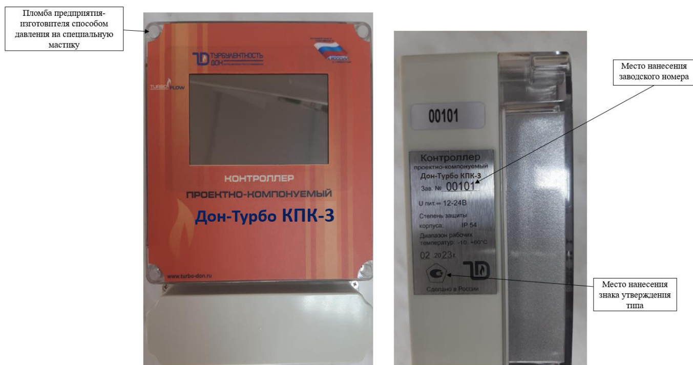
Рисунок 4 – Общий вид контроллеров в исполнении корпуса КПК-3 с указанием места нанесения заводского номера, места нанесения знака утверждения типа и мест пломбировки