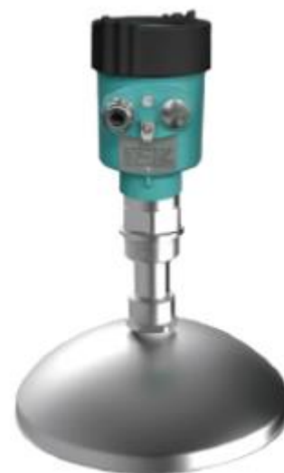
е) резьбовое присоединение с параболической антенной