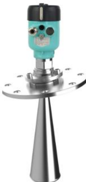
б) фланцевое присоединение с длинной рупорной антенной