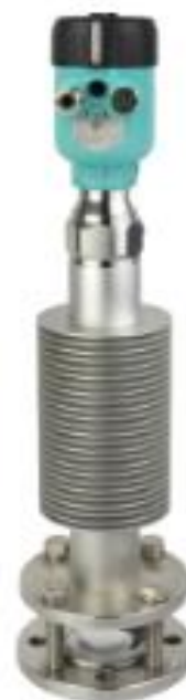
в) фланцевое присоединение для высокотемпературного исполнения