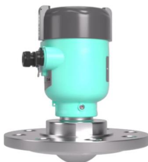
ж) фланцевое присоединение с линзовой антенной