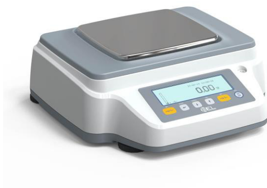
RBG6202 RBG8202 RBG10102 RBG12102

Схема пломбировки от несанкционированного доступа представлена на рисунке 2.