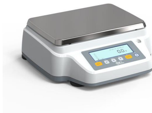
RBG8001 RBG16001 RBG25001 RBG32001