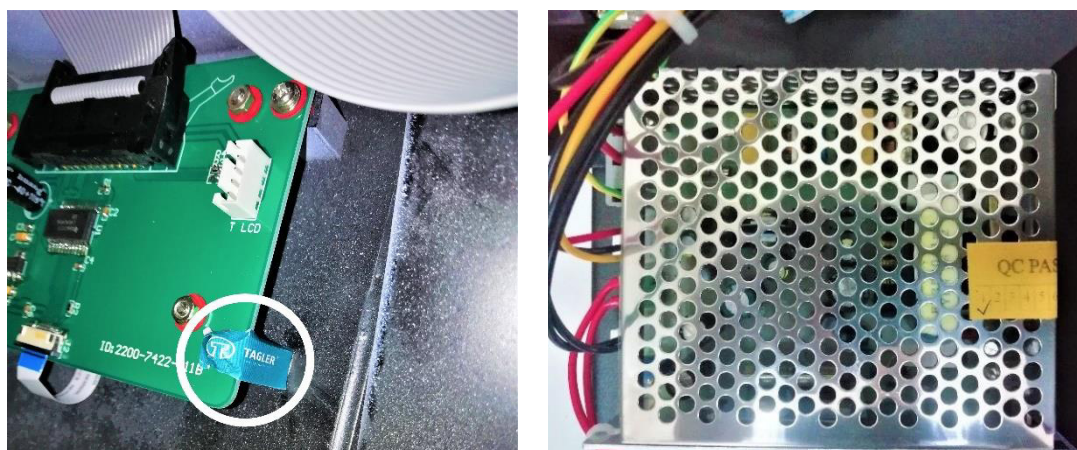
Рисунок 4 – Пломбирование деталей спектрофотометров