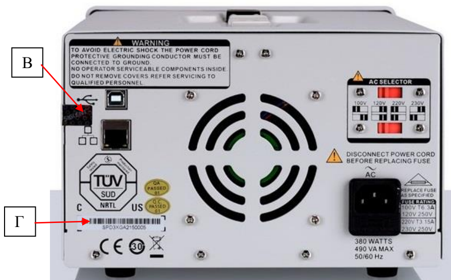
Рисунок 2 – Схема опломбирования от несанкционированного доступа (В) и места нанесения серийного номера (Г)