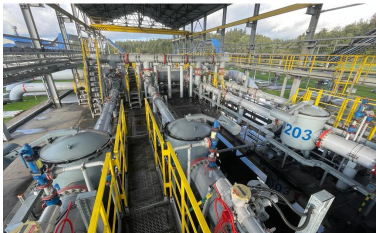
Рисунок 1 - Общий вид СИКН

Особенностью конструкции СИКН является использование резервного БИЛ, контрольно-резервной ИЛ и блока ТПУ для работы с СИКН, расположенных на территории нефтебазы «Усть - Луга».