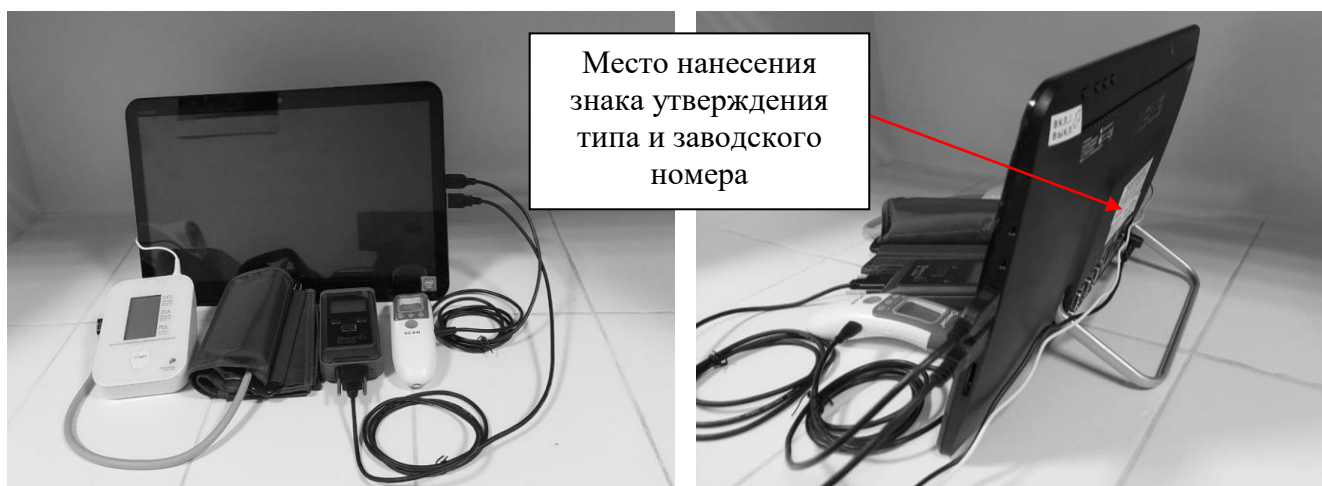
Рисунок 1 – Общий вид приборов исполнения ТачМед ОТМ с указанием места нанесения знака утверждения типа и места нанесения заводского номера