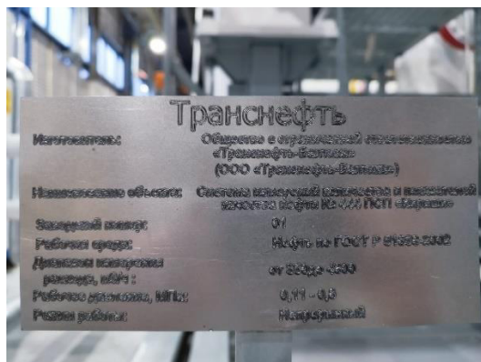
Рисунок 2 – Информационная табличка СИКН

Пломбировка СИКН не предусмотрена. Нанесение знака поверки на СИКН не предусмотрено.