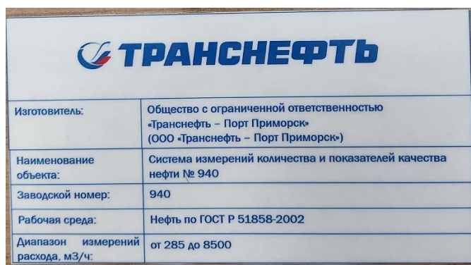
Рисунок 2 – Информационная табличка СИКН