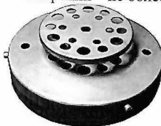
Рисунок 1 – Крышка для установки термопреобразователей диаметрами 6, 8, 10 мм (входит в комплект поставки термостата)

10.1.3.3 При длительном проведении измерений смарт-зондом Testo 915i со сменными датчиками температуры 0602 1093 или 0602 3093 возможен неравномерный прогрев измерительного блока и искажение результатов измерений. Рекомендуется измерения проводить в крышке для термостата переливного (рисунок 1) с целью предотвращения нагрева измерительного блока. Время выполнения измерений – не более 5 минут.