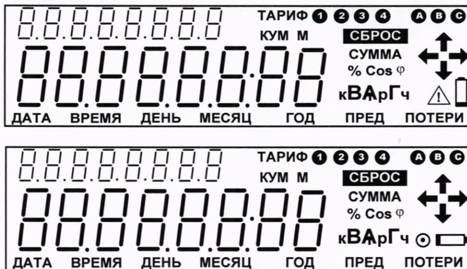
Рисунок 1 – Внешний вид ЖКИ

8.2.4 Внешний вид ЖКИ счётчиков «Меркурий 204», «Mercury 204», «Меркурий 234», «Mercury 234» должен соответствовать рисунку 1 (в счётчике может использоваться ЖКИ одного из двух типов). Для англоязычной торговой марки «Mercury» надписи на ЖКИ могут отображаться на английском языке.