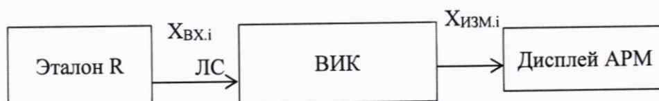
Рисунок 2 - Схема подключений при определении метрологических характеристик ВИК сигналов от термопреобразователей сопротивления

В проверяемом ВИК отсоединяют ЛС от клемм термопреобразователя сопротивления, подключают к ЛС средства поверки (эталон R ко входу ВИК) в соответствии с рисунком 2.