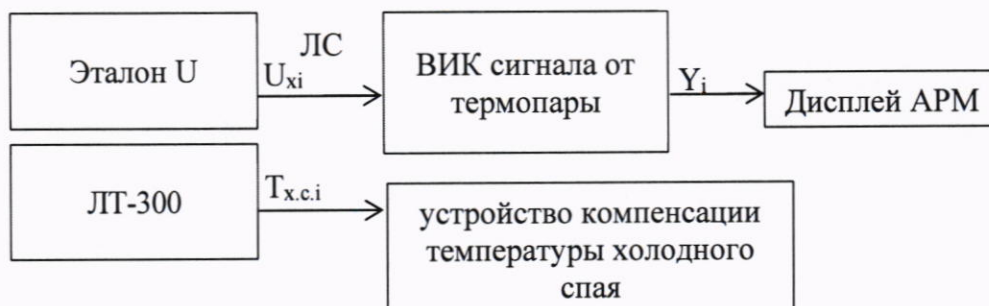
Рисунок 3 - Схема подключений при определении метрологических характеристик ВИК сигналов от термоэлектрических преобразователей (термопар)

Выбирают 5 контрольных точек Z_i , i = 1, 2, 3, 4, 5 , равномерно распределенных по диапазону измеряемой температуры (например, 0 - 5 %, 25 %, 50 %, 75 % и 95 - 100 % от диапазона измерений) и заносят их в протокол поверки.