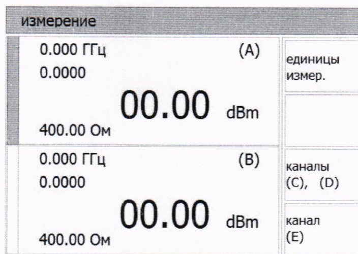
Рисунок 1 – Общий вид окна готовности ваттметра к использованию