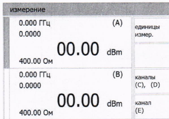
Рисунок 1 – Общий вид окна готовности ваттметра к использованию

8.2.7 Выбрать «канал (E)» и кнопкой «вкл./откл.» включить измерительный канал E.