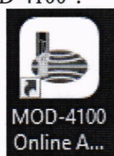
Рисунок 1 - Кнопка запуска программы

9.1 Для инициализации программного обеспечения необходимо дважды щелкнуть по иконке программного обеспечения "MOD-4100".