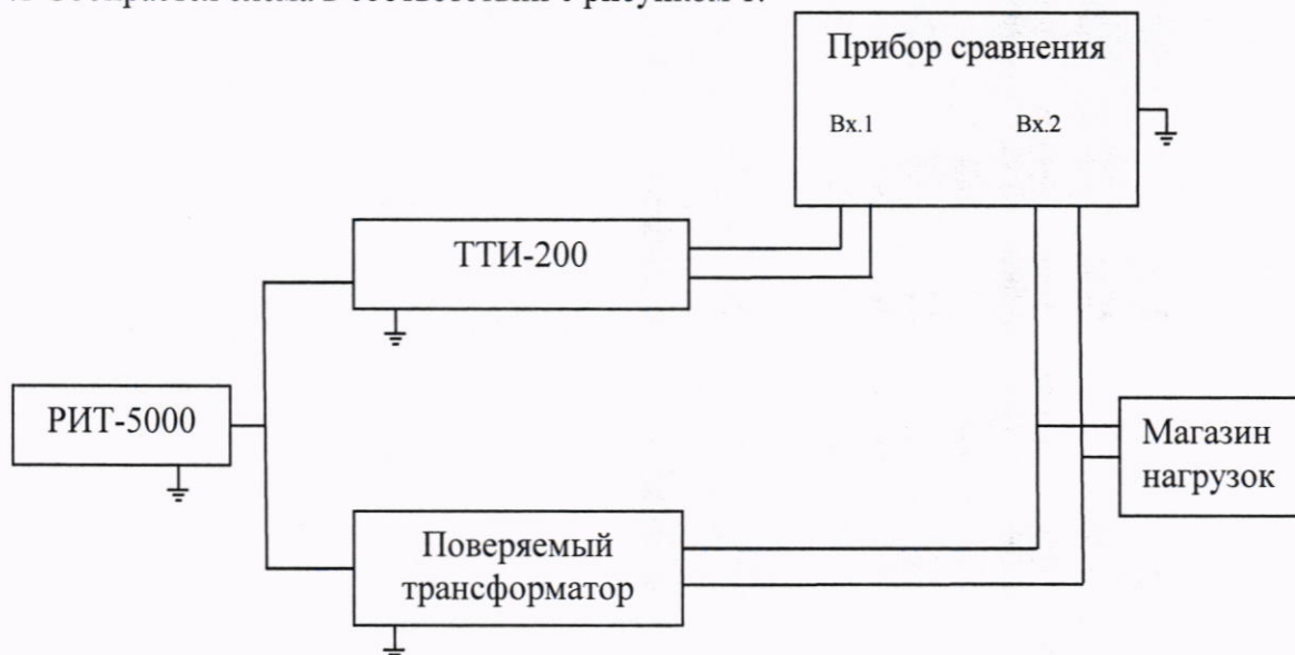
Рисунок 1 – Схема определения токовых и угловых погрешностей трансформаторов

9.1 Собирается схема в соответствии с рисунком 1.