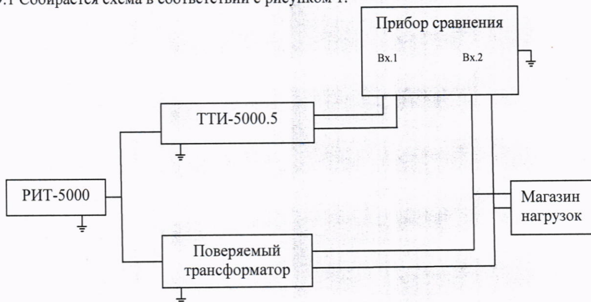
Рисунок 1 – Схема определения токовых и угловых погрешностей трансформаторов

9.1 Собирается схема в соответствии с рисунком 1.