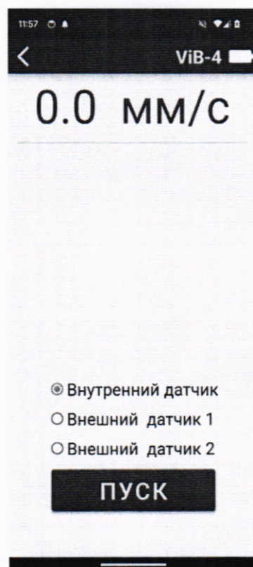
Рисунок 2 – Перевод анализатора в режим управления

7.6 Выберите анализатор для измерений (по названию ViB-1 (ViB-2 или ViB-4) и серийному номеру S/N). Программа перейдет на экран управления (рисунок 2).