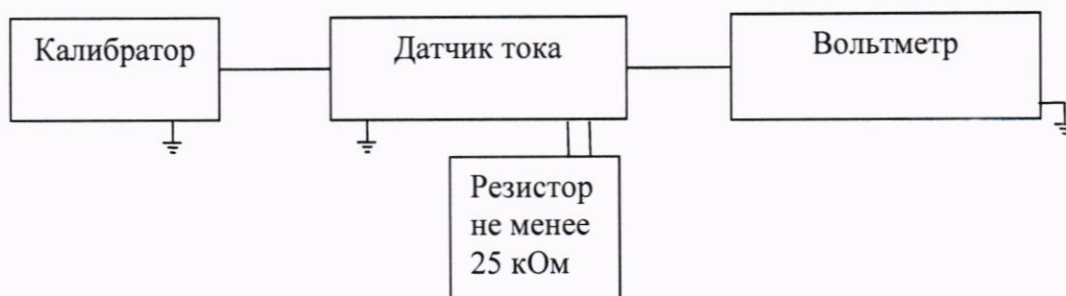
Рисунок 2 - Схема поверки при первичных токах до 10 А

От источника тока подаются следующие значения тока на датчик тока и эталонный трансформатор тока: