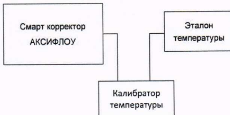
Рисунок 2 – Схема подключения корректора к калибратору температуры

Температуру задают с отклонением не более \pm 1 \text{ K} .