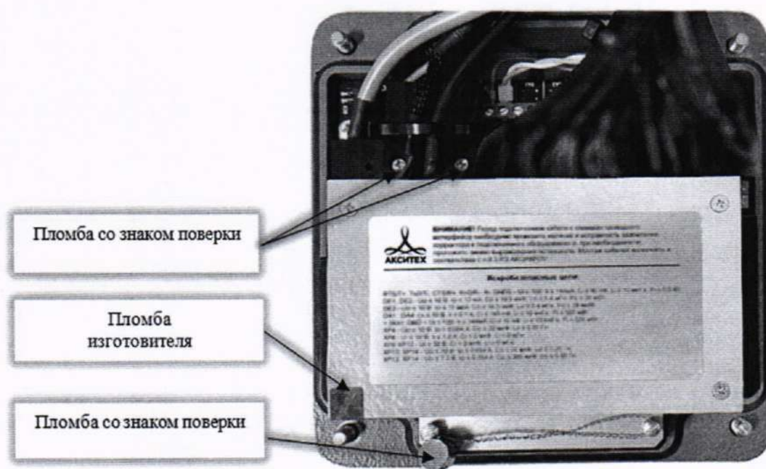
Рисунок Б.1 – Места пломбировки корректора, обозначение места нанесения знака поверки

Места пломбировки от несанкционированного доступа, обозначение мест нанесения знака поверки