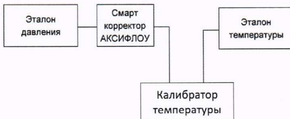
Рисунок 3 – Схема подключения корректора с целью определения относительной погрешности приведений объема к стандартным условиям с учетом погрешности измерения давления, температуры и вычисления коэффициента коррекции

Определение относительной погрешности приведений объема к стандартным условиям с учетом погрешности измерения давления, температуры и вычисления коэффициента коррекции в диапазоне изменения параметров газа: температуры – от минус 30 до плюс 60 °С, плотности – от 0,668 до 1,0 кг/м 3 , используют схему, представленную на рисунке 3.