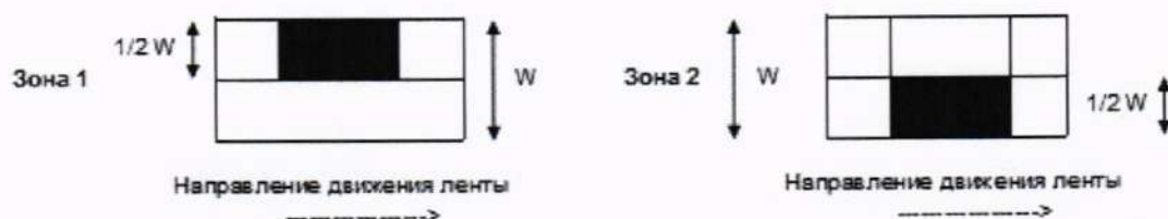
Рисунок 1 — Расположение испытательных нагрузок для СИ, осуществляющих взвешивание динамически

2) Число взвешиваний — по таблице 2 для нагрузки 1/3 \text{ Max} .