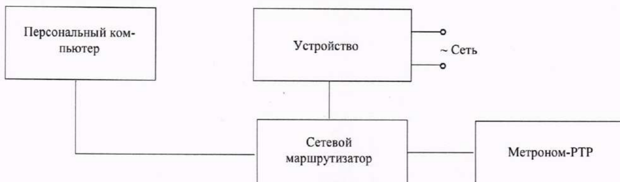
Рисунок 3 - Схема подключений при определении абсолютной погрешности хода часов за сутки

2) Изменить сетевые настройки (IP-адрес и основной шлюз) Метроном-РТР в соответствии с IP-адресом устройства, присвоив устройству и Метроном-РТР один адрес сети и подсети.