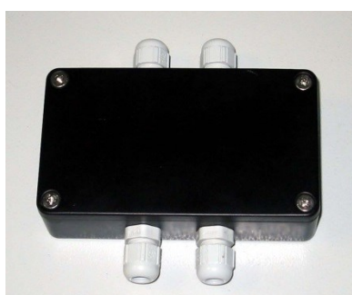
Выносной измерительный модуль ИМ2300ВМ