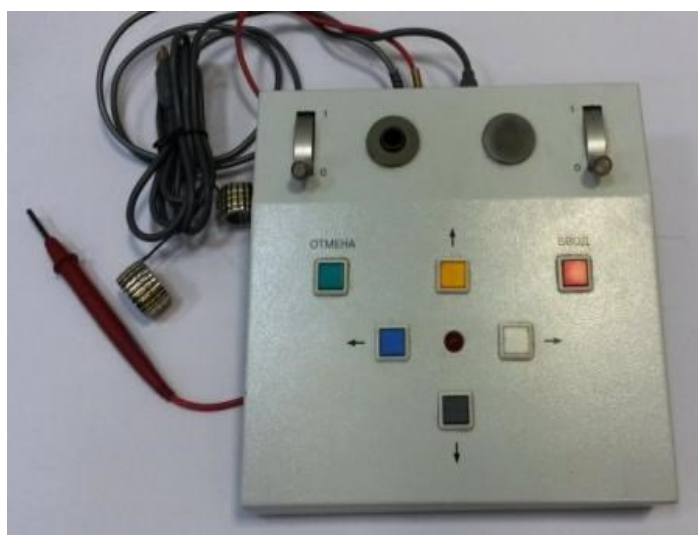
Рисунок 1 – Общий вид пульта испытываемого

Общий вид комплекса диагностического универсального УПДК-МК для видов исполнений НКРМ.466961.001, НКРМ.466961.001-00.01, НКРМ.466961.001-00.02 и схема маркировки представлены на рисунках 1 – 2.