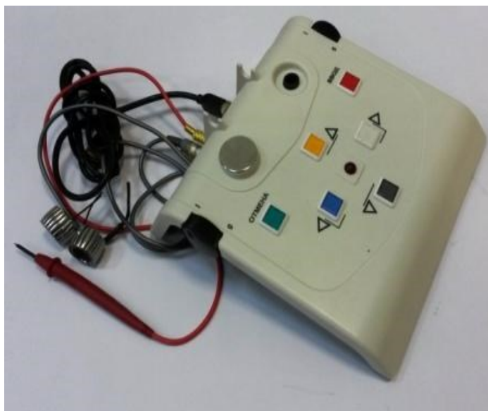
Рисунок 3 – Пульт испытуемого