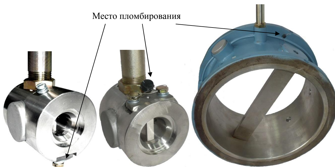
Рисунок 2 – Варианты мест пломбирования в зависимости от Ду