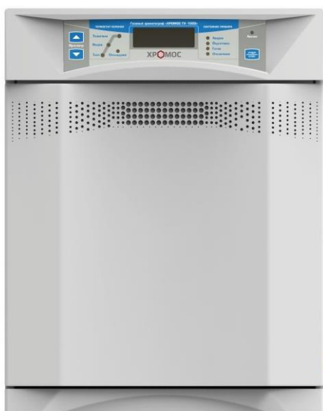
Рисунок 1 – Общий вид комплекса хроматографического газового «Хромос ГХ-1000»

Общий вид комплекса, место нанесения знака утверждения типа и заводского номера приведены на рисунках 1-2.