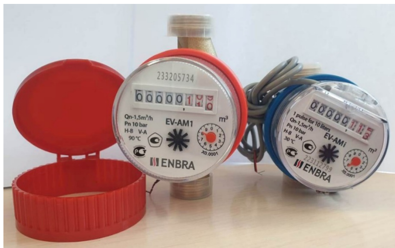
Рисунок 1 – Общий вид счетчиков

Пломбировка счетчиков осуществляется нанесением знака поверки давлением на свинцовую (пластмассовую) пломбу, навешиваемую на внешнюю боковую сторону счетчиков с применением проволоки, пропущенную сквозь отверстия в пломбировочном кольце или нанесением знака поверки на самоклеящуюся наклейку, прикрепляемую на место смыкания пломбировочного кольца, которая соединяет измерительную полость и отсчетное устройство. Схема пломбировки от несанкционированного доступа, обозначение места нанесения знака поверки представлены на рисунке 2.