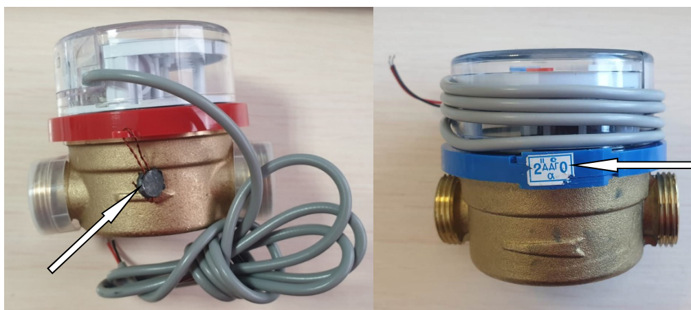
Рисунок 2 – Схема пломбировки от несанкционированного доступа, обозначение места нанесения знака поверки счетчиков

Пломбировка счетчиков осуществляется нанесением знака поверки давлением на свинцовую (пластмассовую) пломбу, навешиваемую на внешнюю боковую сторону счетчиков с применением проволоки, пропущенную сквозь отверстия в пломбировочном кольце или нанесением знака поверки на самоклеящуюся наклейку, прикрепляемую на место смыкания пломбировочного кольца, которая соединяет измерительную полость и отсчетное устройство. Схема пломбировки от несанкционированного доступа, обозначение места нанесения знака поверки представлены на рисунке 2.