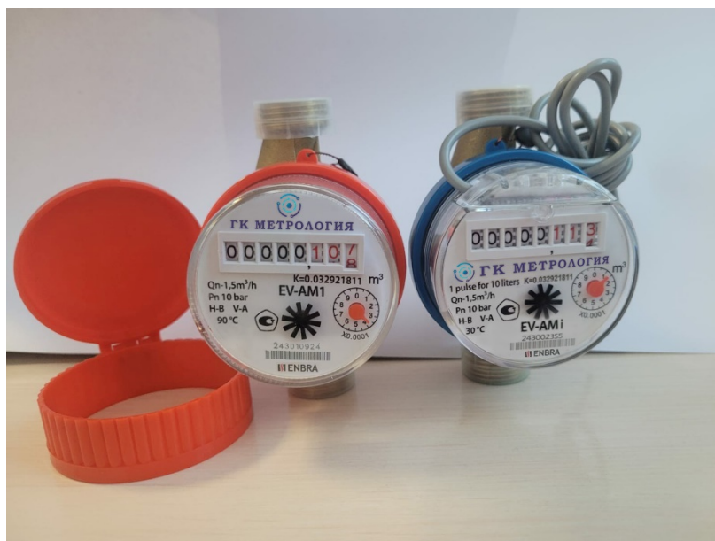
Рисунок 4 – Общий вид счетчиков с изображением товарного знака ГК Метрология

Счетчики могут выпускаться с изображением товарного знака ГК Метрология на лицевой панели. Общий вид счетчиков изображен на рисунке 4.