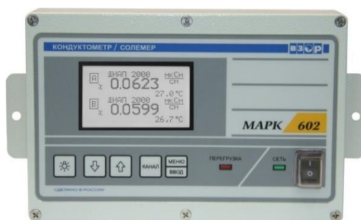
а – Общий вид