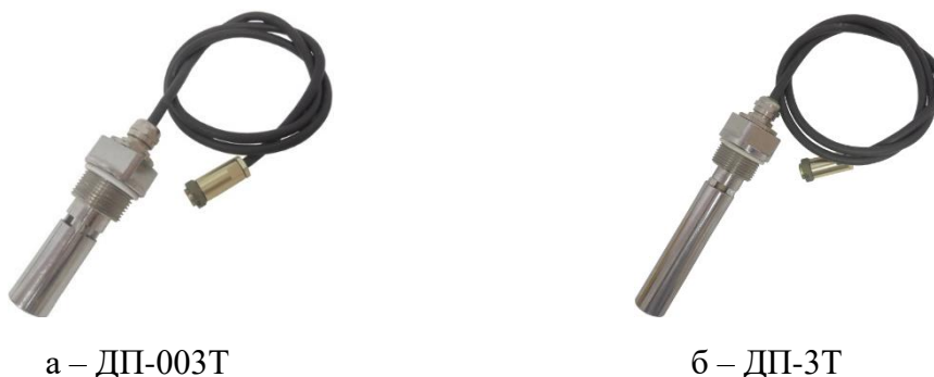
Рисунок 5 – Датчики проводимости ДП-003Т, ДП-3Т