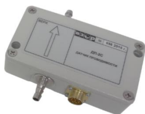
а – ДП-025С (ДП-2С)