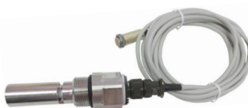
б – ДП-003МП