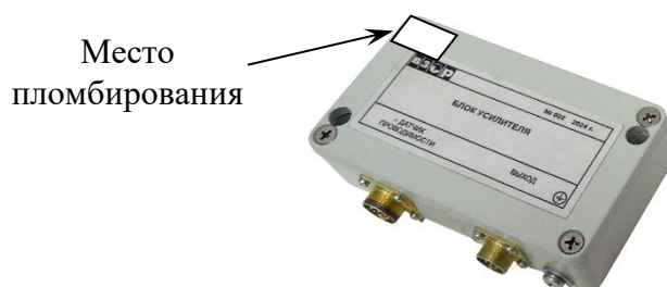
Рисунок 4 – Блок усилителя БУ-602Т