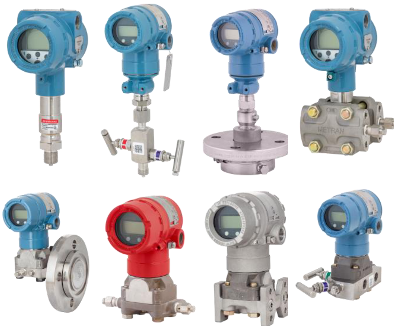
Рисунок 1 – Общий вид датчиков

Пломбирование датчиков не предусмотрено. Нанесение знака поверки на средство измерений не предусмотрено.