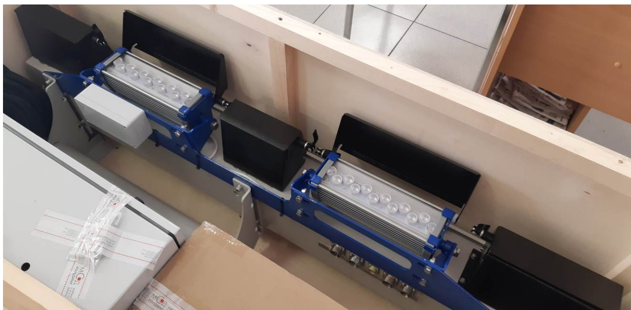
Рисунок 1 – Устройство слежения за параметрами контактного провода «Визир»

Знак поверки наносится на свидетельство о поверке в виде наклейки и (или) оттиска поверительного клейма.