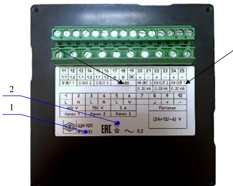
Рисунок 2 – Общий вид приборов ЩК120 с указанием мест нанесения заводского номера и знака утверждения типа