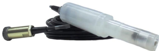
б - Датчик кислородный ДК-409