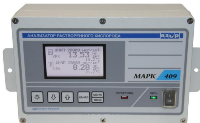
а - Блок преобразовательный

Схема пломбирования от несанкционированного доступа к элементам конструкции, обозначение места нанесения знака поверки представлены на рисунке 2.