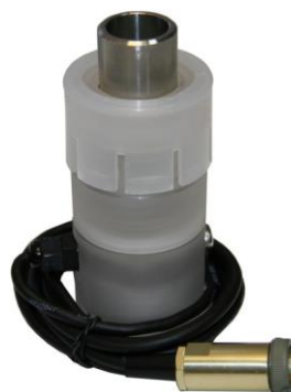
в - Датчик кислородный ДК-409Т (ДК-409ТМ)