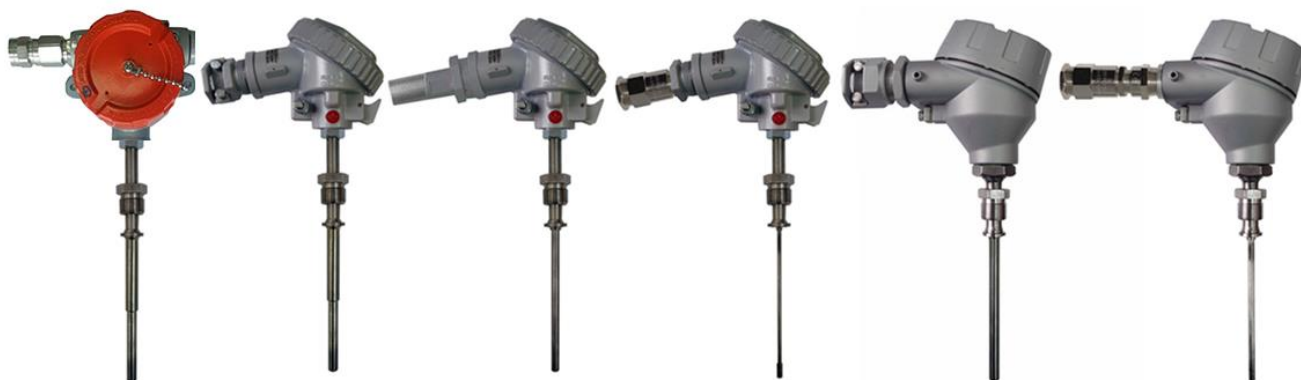
Рисунок 5 – Погружаемые взрывозащищенные ТС-Exd, ТС-Exdi