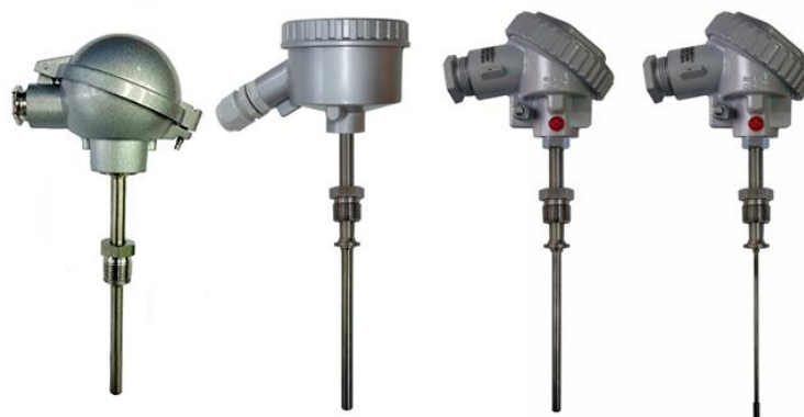
Рисунок 1 – Погружаемые общепромышленные ТС-Оп и взрывозащищенные ТС-Ехi