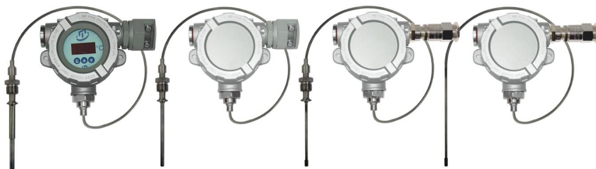
Рисунок 7 – Погружаемые кабельные взрывозащищенные ТС.К-Exd, ТС.К.ИНД-Exd, ТС.К-Exdi, ТС.К.ИНД-Exdi