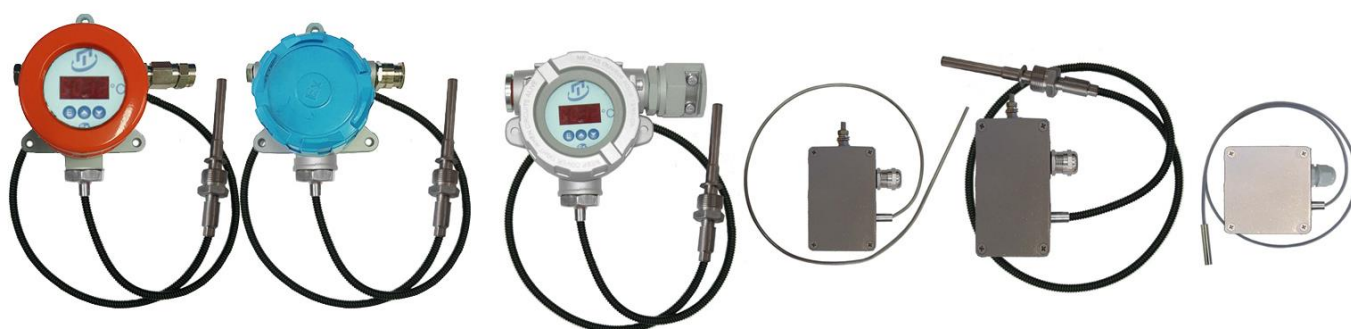
Рисунок 2 – Погружаемые кабельные общепромышленные ТС.К-Оп, ТС.К.ИНД-Оп и взрывозащищенные ТС.К-Ехi, ТС.К.ИНД-Ехi