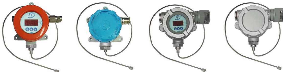
Рисунок 8 – Поверхностные общепромышленные ТС.П.ИНД-Оп и взрывозащищенные ТС.П-Exd, ТС.П-Exi, ТС.П-Exdi, ТС.П.ИНД-Exd, ТС.П.ИНД-Exi, ТС.П.ИНД-Exdi