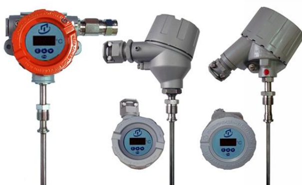
Рисунок 6 – Погружаемые общепромышленные ТС.ИНД-Оп и взрывозащищенные ТС.ИНД-Exd, ТС.ИНД-Exi, ТС.ИНД-Exdi