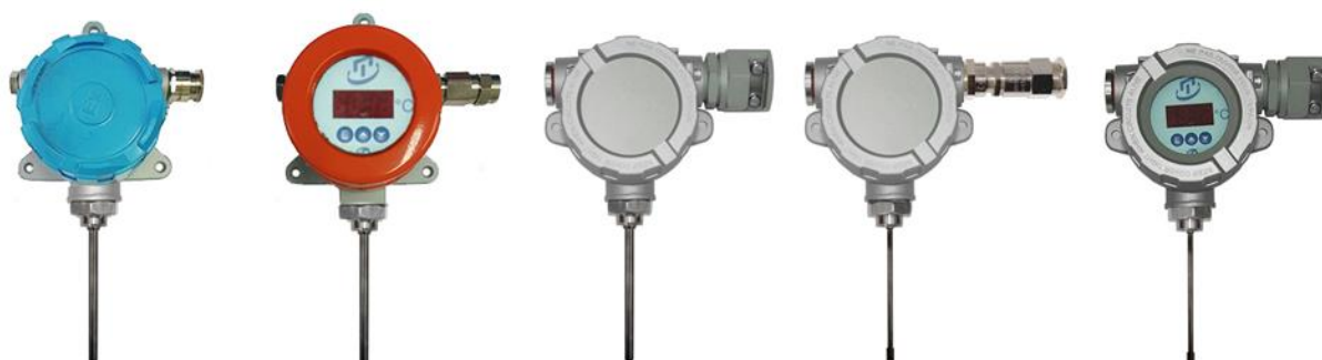
Рисунок 9 – Общепромышленные ТСп.ИНД-Оп и взрывозащищенные ТСп-Exd, ТСп-Exdi, ТСп.ИНД-Exd, ТСп.ИНД-Exdi для измерений температуры окружающей среды (воздуха)