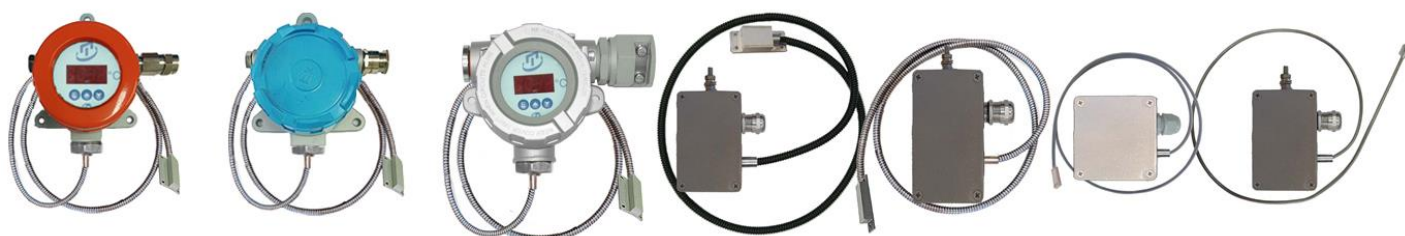
Рисунок 3 – Поверхностные общепромышленные ТС.П-Оп, ТС.П.ИНД-Оп и взрывозащищенные ТС.П-Ехi, ТС.П.ИНД-Ехi