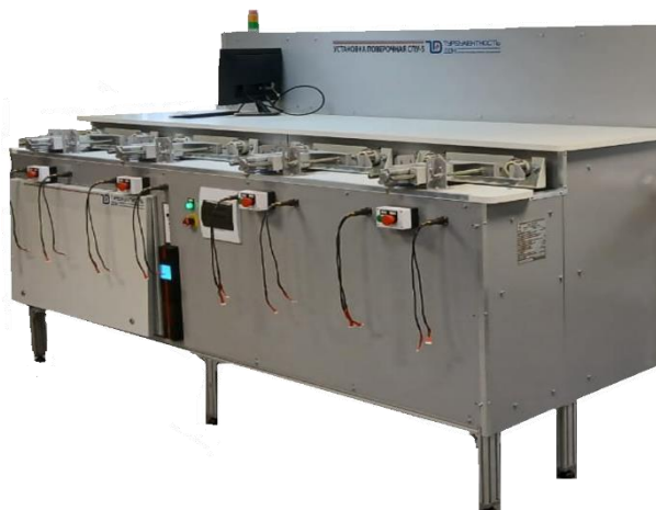
Рисунок 5 – СПУ-5-Х-3 Установка с восемью одновременно подключаемыми счетчиками