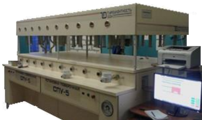
Рисунок 4 – СПУ-5-Х-3 Установка с тридцатью одновременно подключаемыми счетчиками