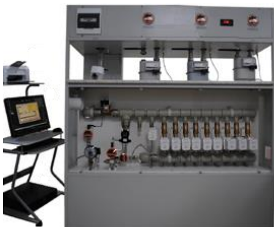
Рисунок 3 – СПУ-5-Х-3 Установка с четырьмя одновременно подключаемыми счетчиками