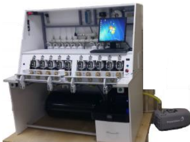
Рисунок 2 – СПУ-5-Х-1 Установка с десятью одновременно подключаемыми счетчиками