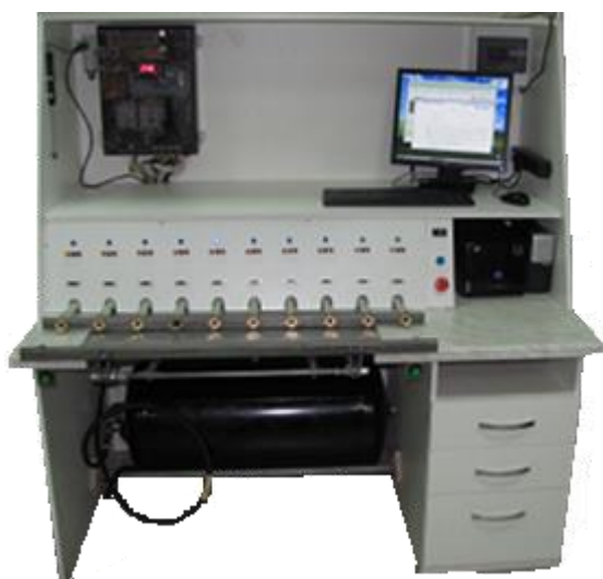
Рисунок 1 – СПУ-5-Х-1 Установка с десятью одновременно подключаемыми счетчиками

Пломбирование установок не предусмотрено. Цифровой заводской номер установок наносится на маркировочную табличку методом лазерной гравировки или термотрансферной печати. Общий вид маркировочной таблички представлен на рисунке 6.