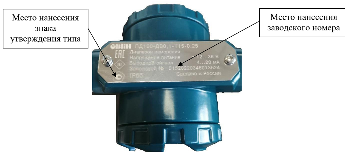
Рисунок 4 – Место нанесения знака утверждения типа, место нанесения заводского номера преобразователей давления измерительных ОВЕН ПД100 в полевом корпусе

Пломбирование преобразователей не предусмотрено.