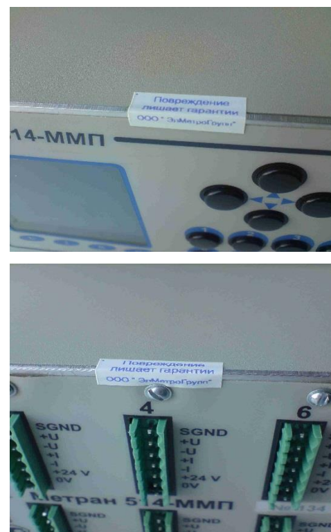
Рисунок 2 – Схема и внешний вид пломбировки мультиметра от несанкционированного доступа.