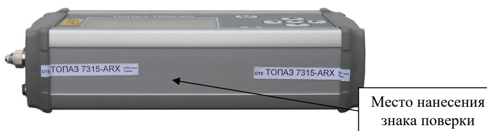
Рисунок 2 – Схема пломбировки тестеров от несанкционированного доступа, обозначение места нанесения знака поверки

Элементы настройки измерительной части тестеров конструктивно защищены. Корпус тестера опломбирован снаружи сбоку пломбой в виде наклейки, которая имеет разрушаемый слой, и при попытке несанкционированного вскрытия повреждается. Схема пломбировки тестеров от несанкционированного доступа, обозначение места нанесения знака поверки приведены на рисунке 2.