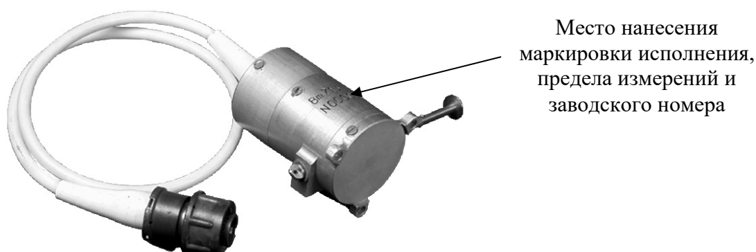
Рисунок 1 – Общий вид преобразователя

Маркировка исполнения (шифр) и предел измерения в виде буквенно-цифрового обозначения, заводской номер в виде цифрового обозначения выполняются методом гравирования на корпусе преобразователя.