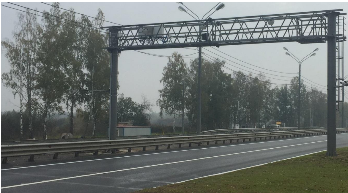
Рисунок 1 – Общий вид комплексов «АВАКС»-М