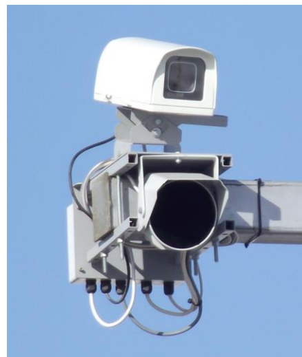
Рисунок 2 – Одиночный ТВ датчик с ИК системой освещения