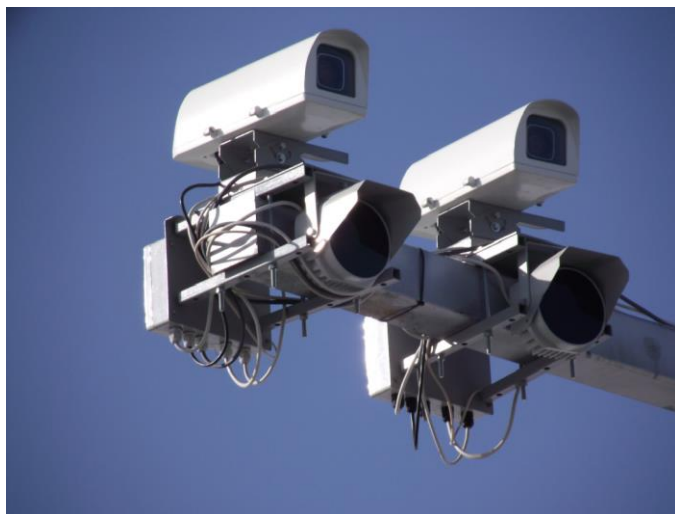
Рисунок 1 – Парные ТВ датчики с ИК системой освещения