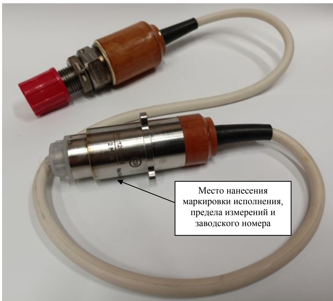
Рисунок 1 - Общий вид датчика