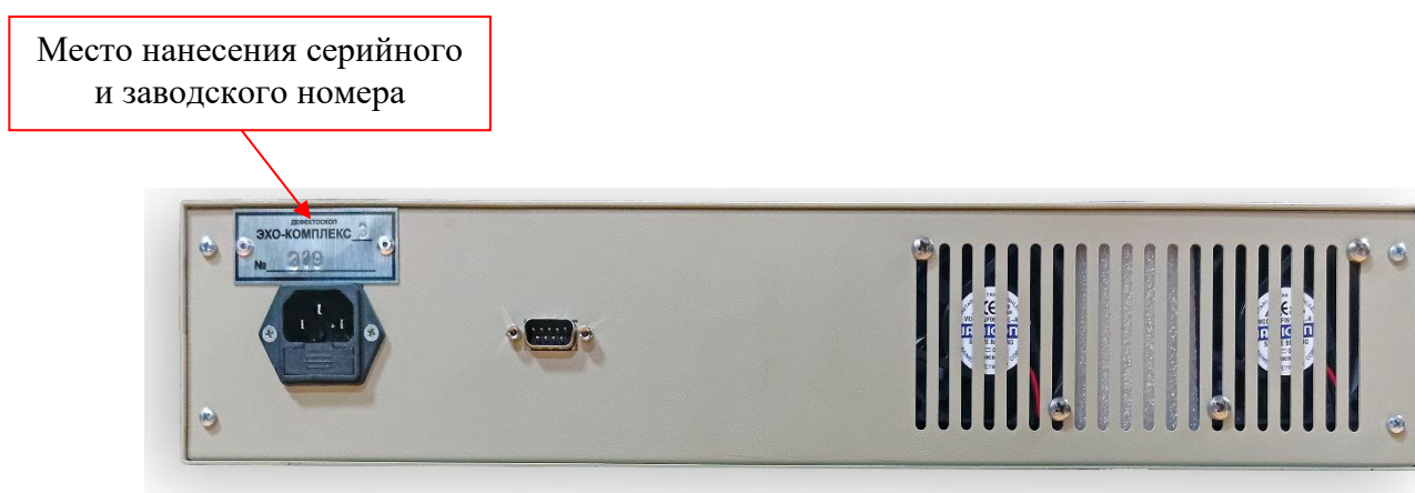
Рисунок 2 – Место нанесения серийного и заводского номера

Пломбирование дефектоскопов не предусмотрено.