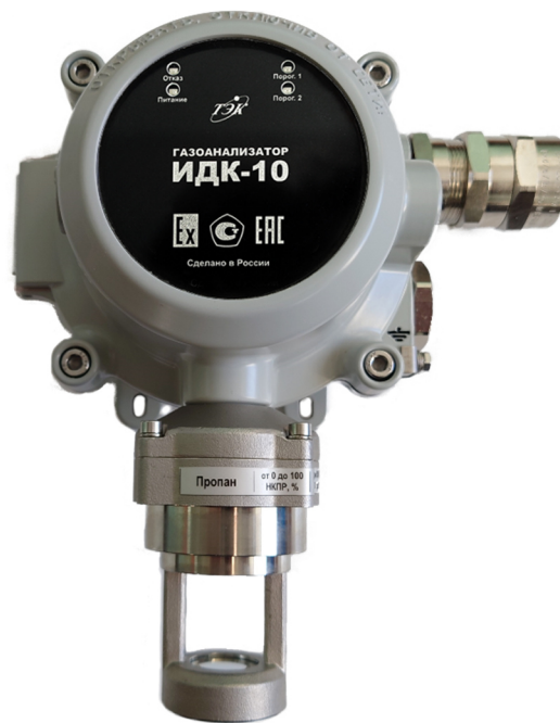
а) с брызгозащитным кожухом