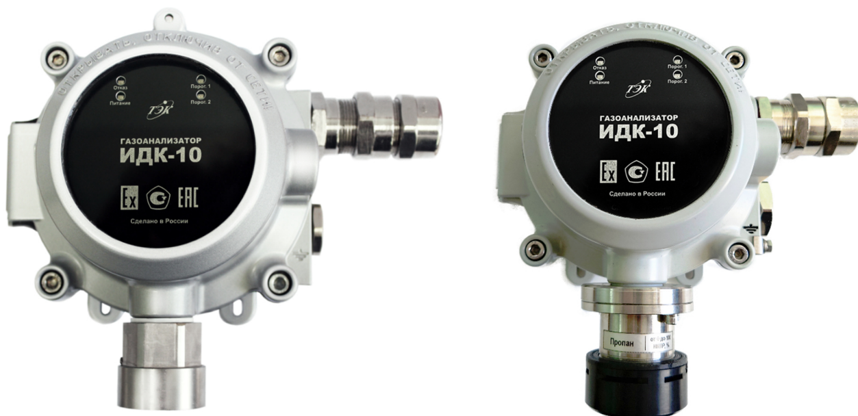
Рисунок 3 – Газоанализатор модификации ИДК-10-Х1 с оптическим сенсором без дисплея (конструктивное исполнение 3)