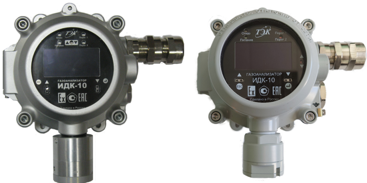
Рисунок 2 – Газоанализатор модификации ИДК-10-X2 с термокatalитическим сенсором