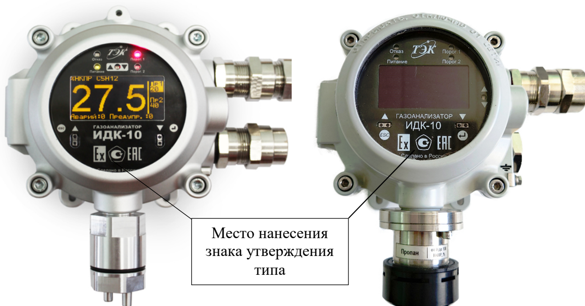
Рисунок 1 – Газоанализаторы модификации ИДК-10-X1 с оптическим сенсором и место нанесения знака утверждения типа

Заводской номер наносится типографским, ударным методом или методом гравировки в виде цифрового обозначения на табличку, расположенную на корпусе газоанализатора. Общий вид таблички с указанием заводского номера представлен на рисунке 7.