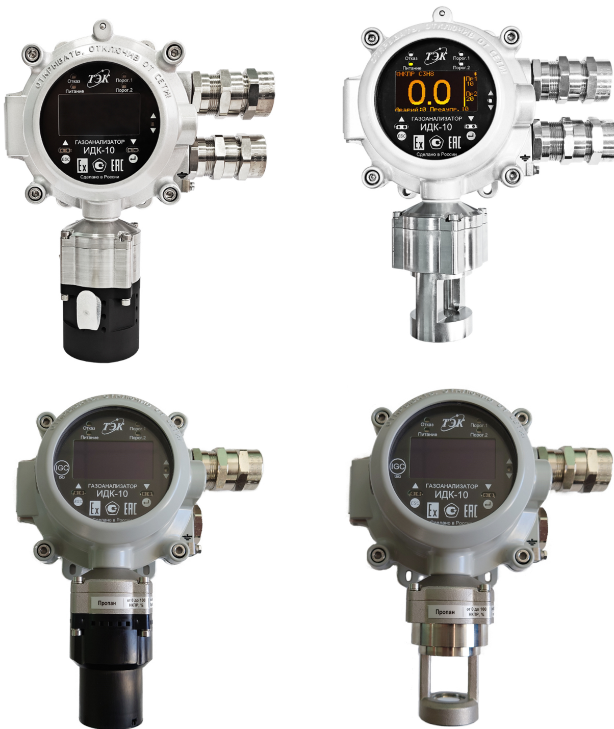
а) с брызгозащитным кожухом