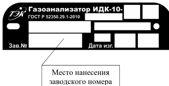
Рисунок 7 – Общий вид таблички с указанием заводского номера газоанализатора