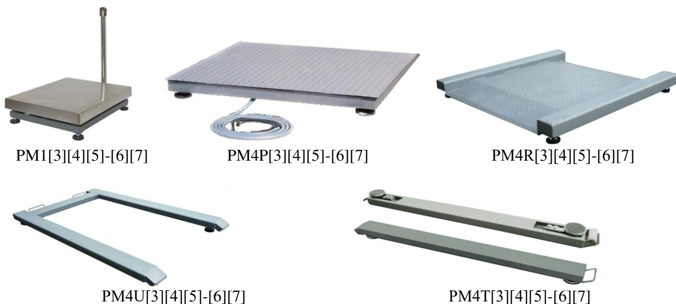
Рисунок 1 – Общий вид ГПУ весов

Схема пломбировки от несанкционированного доступа, обозначение места нанесения знака поверки представлены на рисунке 3.