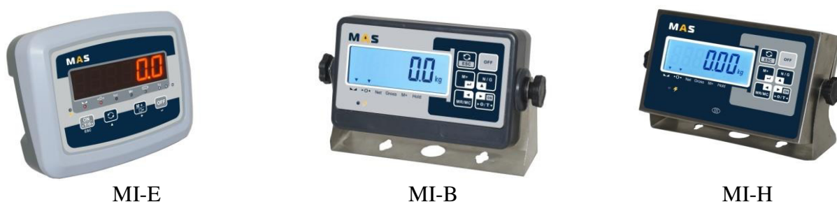
Рисунок 2 – Общий вид индикаторов