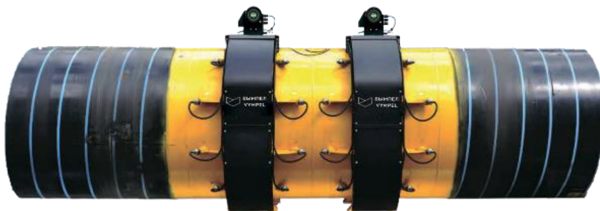
Р и с у н о к 2 – Комплекс измерительный ультразвуковой «Вымпел-500» исполнение «02»