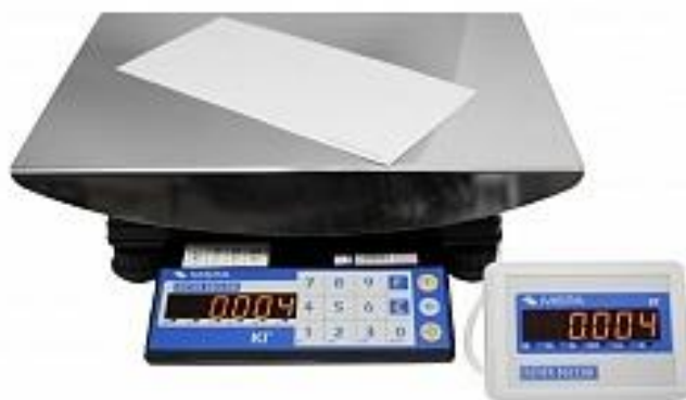
Рисунок 1 – Общий вид весов почтовых электронных ВП-І с вторичным цифровым дисплеем