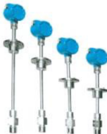
Рисунок 2 – Общий вид датчиков расхода ДРС модификации ДРС.3