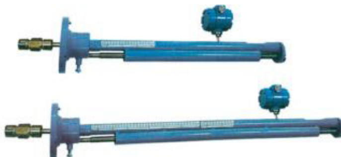
Рисунок 3 – Общий вид датчиков расхода ДРС модификации ДРС.3(Л)