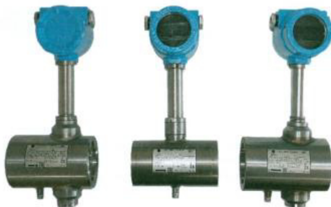
Рисунок 1 – Общий вид датчиков расхода ДРС модификации ДРС