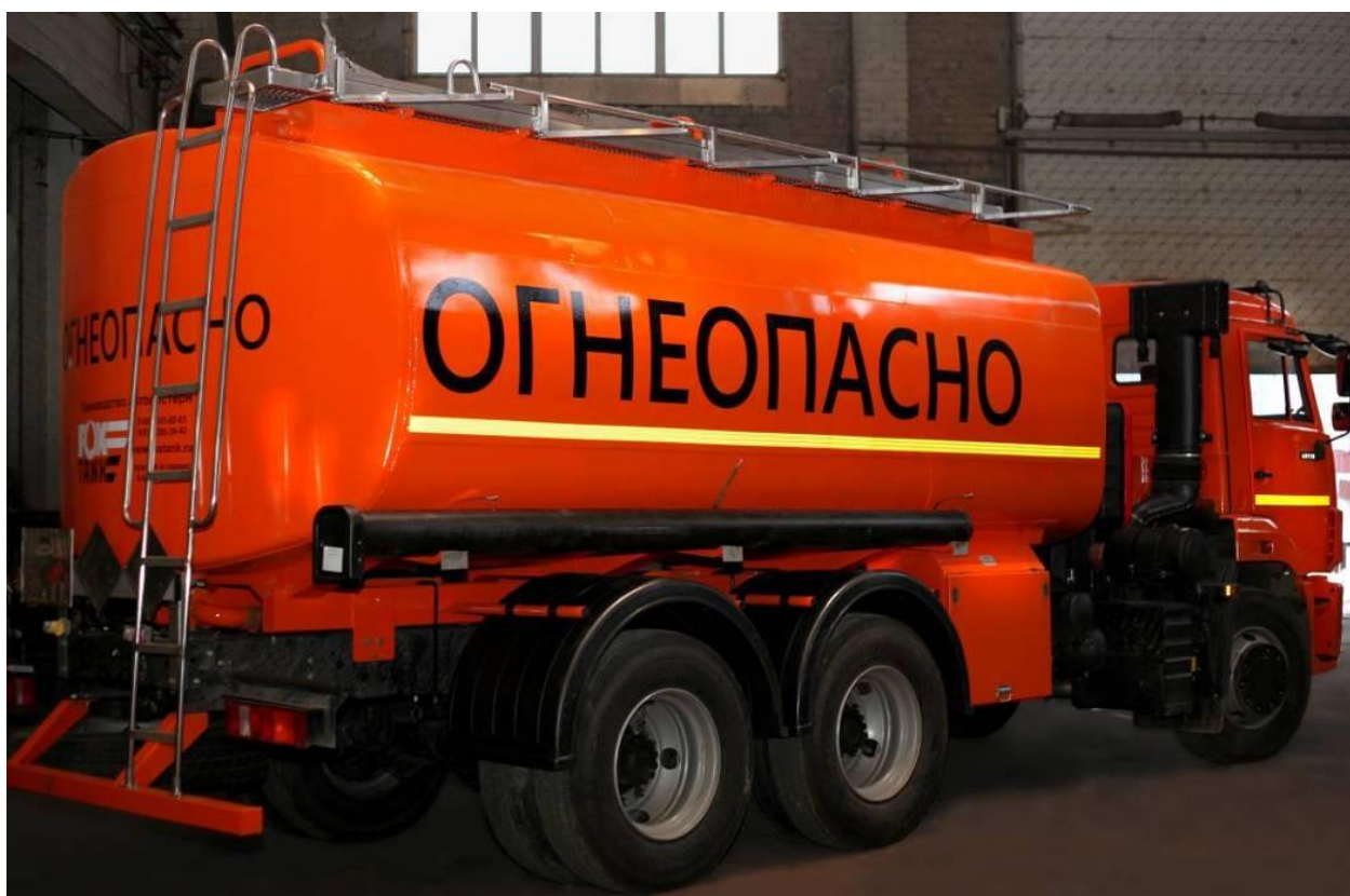
Рисунок 1 – Общий вид автотопливозаправщика ФоксТанк-АТЗ-15

Знак утверждения типа на средство измерений не наносится.