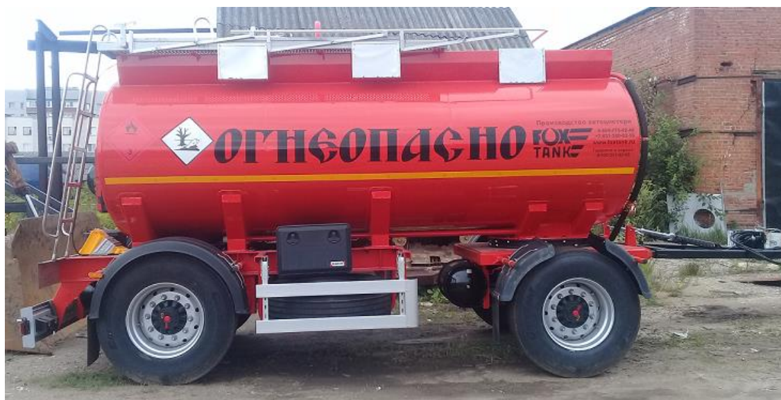
Рисунок 3 – Общий вид прицепа-цистерны ФоксТанк-ПЦ-12