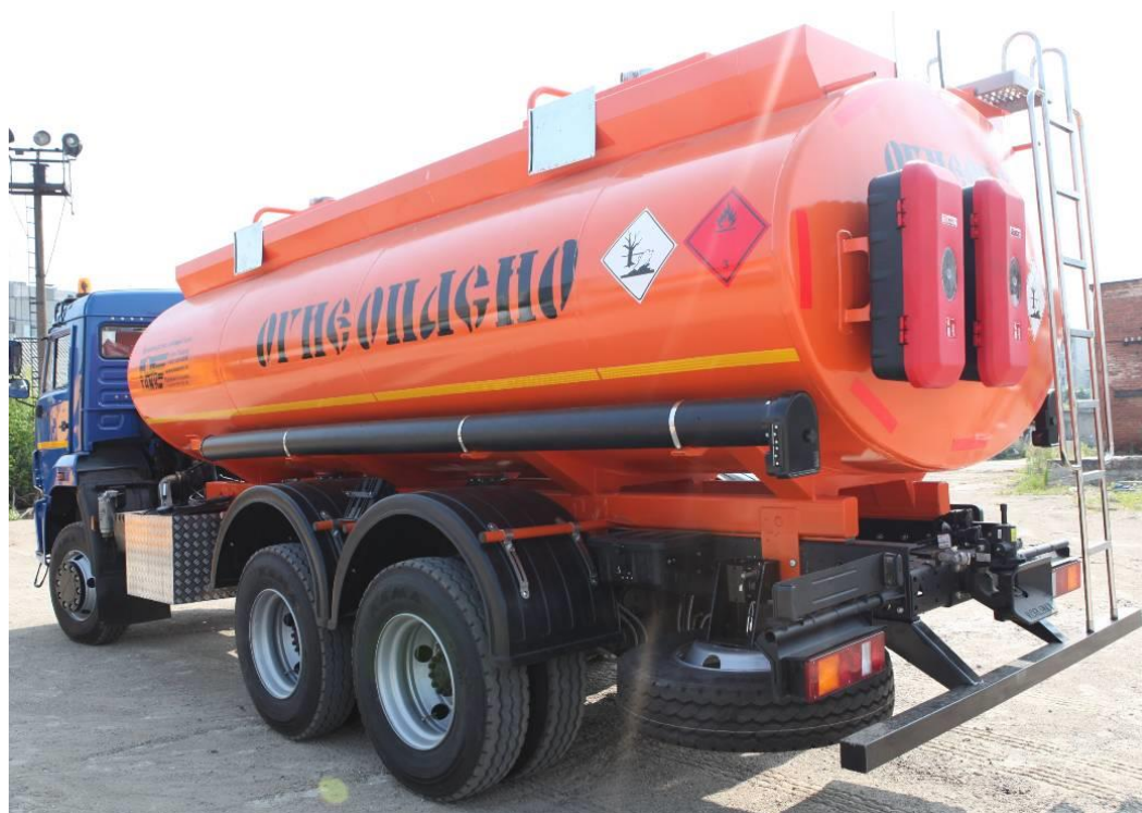
Рисунок 2 – Общий вид автоцистерны ФоксТанк-АЦ-15