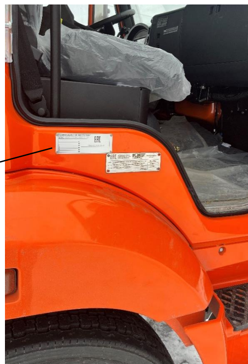
Рисунок 4 – Место нанесения заводского номера АЦ и АТЗ