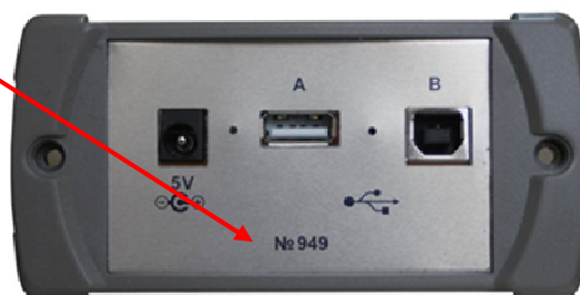
Рисунок 3 – Вид сбоку (электрические разъемы)