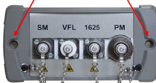
Рисунок 4 – Вид сбоку (оптические разъемы)