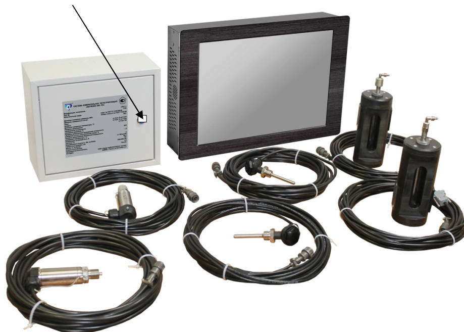
Рисунок 2 – Фотография общего вида модификации I - «Терминал»