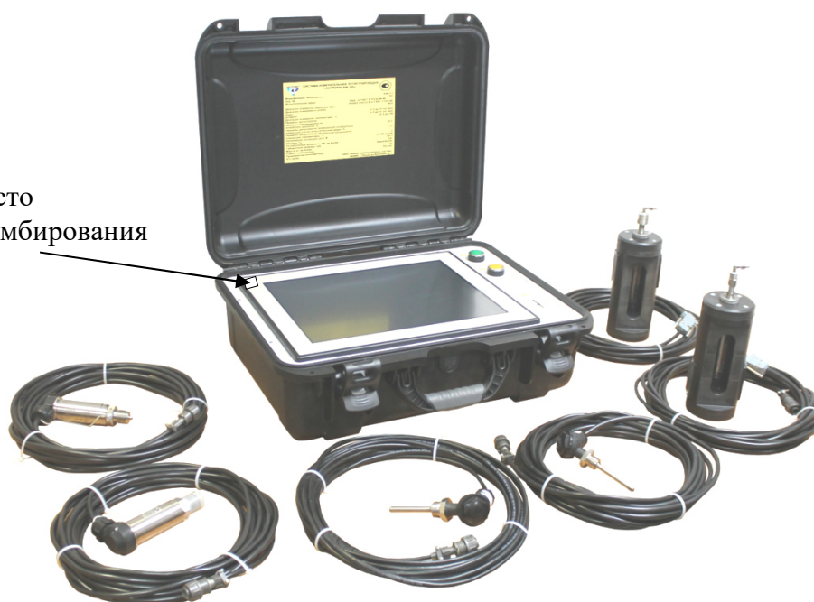
Рисунок 3 – Фотография общего вида модификации II - «Промышленный кейс»